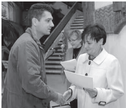
A Pest Megyei Tárlat díjának átvétele

– Gyermekkoromban nem érdeklődtem különösebben a képzőművészet iránt, bár volt osztálytársaim azt mondták, hogy nem rajzoltam rosszul. Aztán a gimnázium 3. osztályában elhatároztam, hogy építész leszek, és ezt a tervemet meg is valósítottam, hiszen 1988-tól ez a hivatásom, és ez nagyon hosszú ideig ki is elégített. 1996-ban terveztem egy családi házat, s azon az épületen volt egy fe-