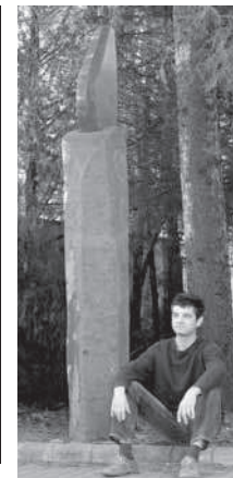
Bodzán Antal szobrai